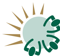
Table de concertation des aînés de Beauce-Sartigan